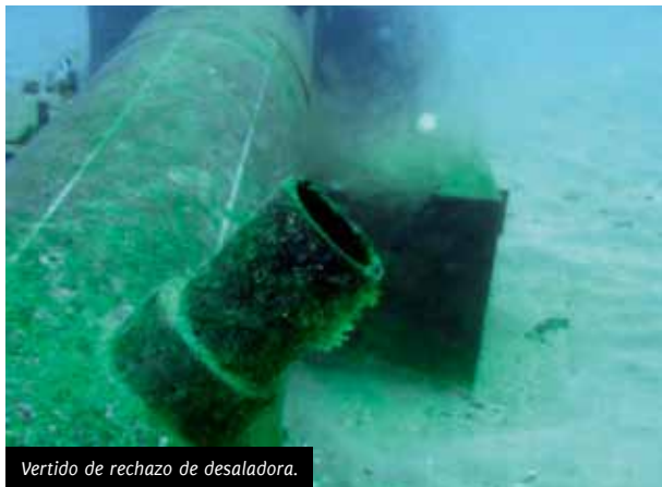
Vertido de rechazo de desaladora.