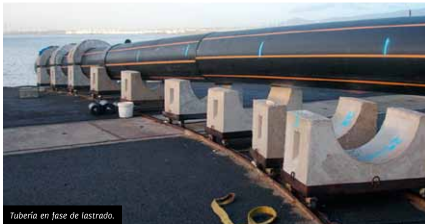
Tubería en fase de lastrado.