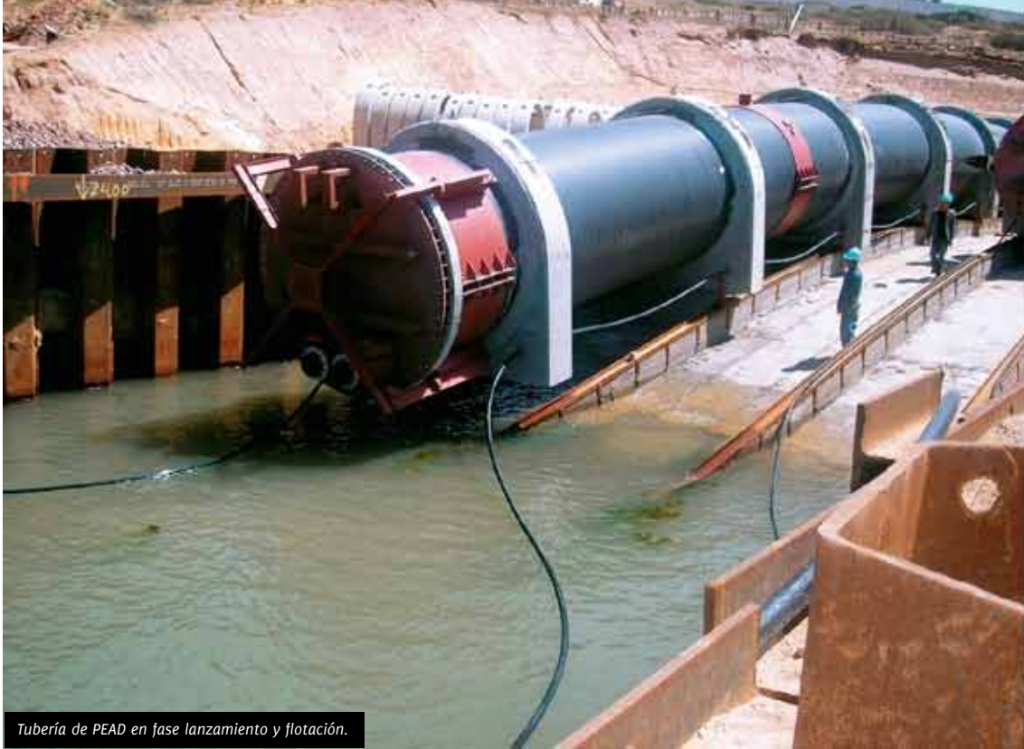
Tubería de PEAD en fase lanzamiento y flotación.