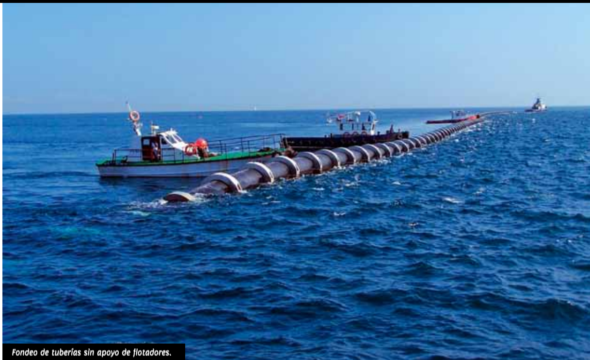
Fondeo de tuberías sin apoyo de flotadores.

Para tuberías de diámetros pequeños (1600 mm e inferiores), se ha recomendado históricamente, el fondeo controlado por inundación progresiva de la tubería. Este sistema constructivo consiste en la fabricación de tramos de tubería en tierra (en una zona que puede estar alejada de la ubicación definitiva del tubo), su traslado flotando hasta destino y su hundimiento controlado, mediante el llenado con agua del interior de la tubería, lo cual da lugar al descenso hacia el fondo del mar de la parte inundada, generándose la característica "S".