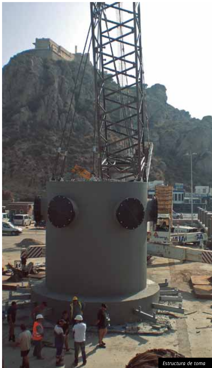
Estructura de toma

Solo empresas altamente especializadas pueden dar este servicio.